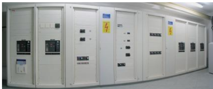
Die typgeprüften Niederspannungsschaltanlagen von Schneider Electric sorgen für reibungslosen und störungsfreien Energietransport