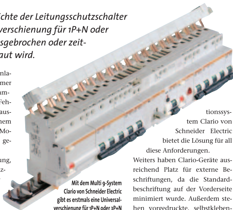
Mit dem Multi 9-System Clario von Schneider Electric gibt es erstmals eine Universalverschienung für 1P+N oder 3P+N

Zeitgewinn bei der Verschienung, Verschienungssicherheit, Platzersparnis und Austausch der Geräte in Betrieb ohne Demontage der Verschienung: Das neue Installa-